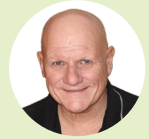
Olav Gunnar Ballo, lege og skribent