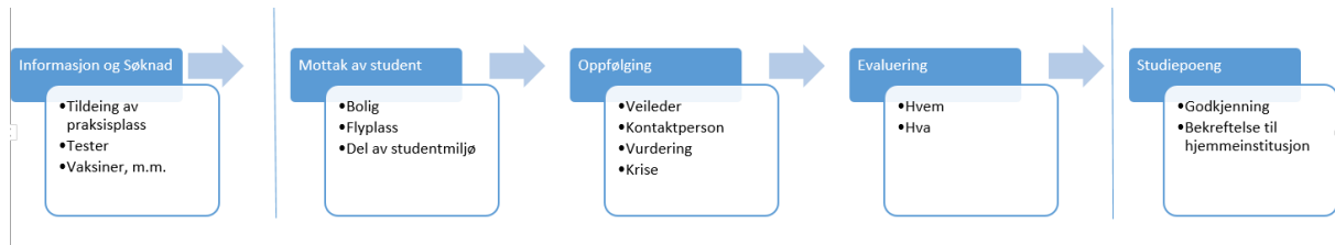
Figur 2: Modell på studentprosessen inn

Vi har delt studentprosessen inn i 3 faser, hva som foregår før mobiliteten, under oppholdet inklusiv evaluering og i etterkant. Hver del starter med å gi en skjematisk oversikt over hva som blir gjort på de ulike utdanningen, deretter blir utfordringene drøftet før vi kommer med noen anbefalinger.